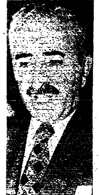
الرئيس كرامي يتحدث مع الصحفيين لدى مغادرته قصر بعبدا بعد ظهر امس

لبنان الزهر ولبنان الرصاص المنطقة تحت ازماتها الصعبة استعدادهما لحل الأزمة الكبرية بالتوسط السياسية او بالحرب - الوساطة السورية بين سوريا والعراق وجدت حلا لزمة مياه العرابت - وصحى قد تل ازمها مع ليبيا في اجناع الرؤساء الصناديق والادب والذاني ، ضمن اطوار اجتماعات رؤساء اتحاد الجمهوريات العربية - والرئيس الاسد الذي يكاد يثني من اقامة القيادة السورية - الطسطنية ، بسوز الارمن قبل الاجتماعات الرياسي القرض بين السادات والرئيس والملك حسين واباس مرغبات - وعلى الصعيد الدولي ، دمشق تعاور موسكو والقاهرة تصاور واشتغل - كل شيء يبدو بنسقا ومربعا وفقا لحسن الاستراتيجية - العربية التي وضعت في قبة الرضا ، باستثناء الوضع في لبنان